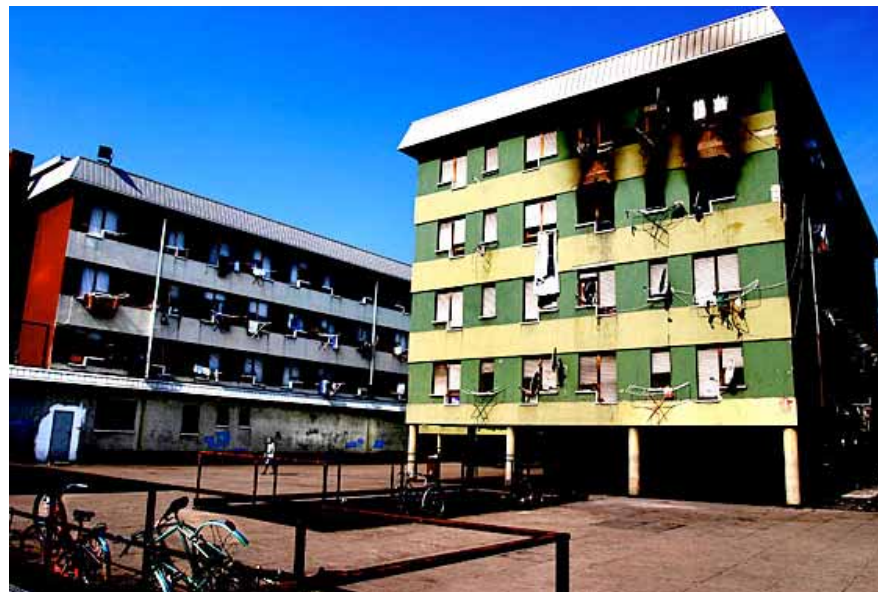
Via Anelli, complexe La Serenissima

"déconcentration" des services, il sera difficile d'arriver à lutter contre des phénomènes d'exclusion spatiale.