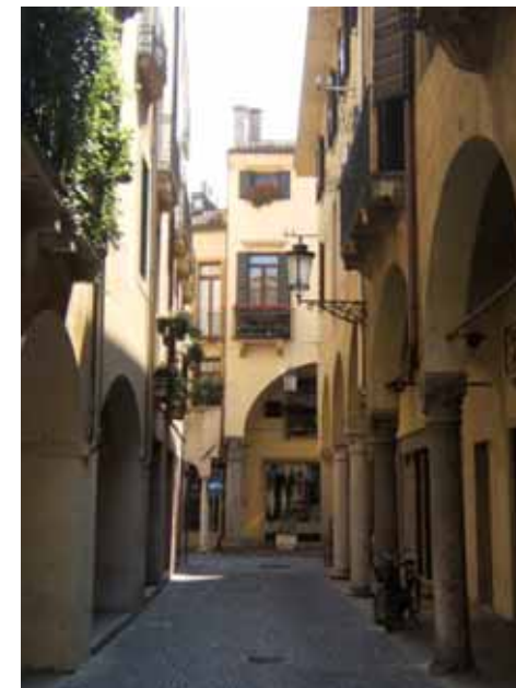
Rue du centre de Padoue

Malgré le développement de ces zones urbaines au cours des dernières décennies, limité par sa nature historique, le centre n'a pas suivi cette évolution. Et en raison des nouveaux besoins des citoyens, il risque fort bien d'être progressivement vidé de ses habitants (situation déjà présente à Venise). En effet, le prix des logements du centre s'est accru de manière exponentielle et est devenu inabordable pour beaucoup ces derniers temps, car vivre au centre signifie :