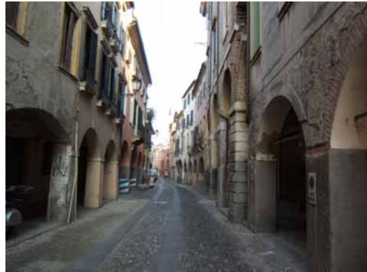
Rue du centre historique de Padoue (Quartier du Ghetto)

(2) Via Venezia avec le centre commercial Giotto, un Auchan, un Décathlon, un Leroy Merlin (normal, ils appartiennent au même groupe)