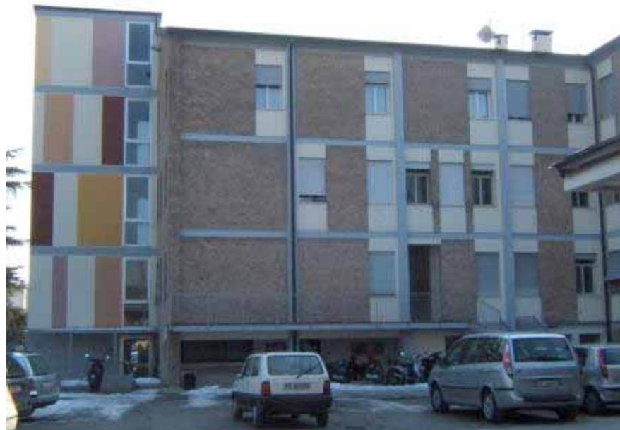
Via del Commissario 42, pôle associatif