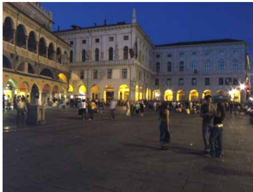
Le Spritz sur la Piazza del Erbe : une institution

Ayant eu la chance d'avoir déjà quelques contacts sur place, je suis arrivé avec les clés d'un joli studio dans le centre qui m'attendait, ainsi que celles d'un cadenas pour bicyclette, me permettant de faire les 5 kilomètres séparant le centre-ville du siège de Villaggio Solidale, l'association pour laquelle je travaillerai durant ces quatre mois.