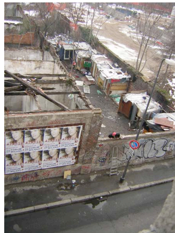
un camp rom à côté de la « stecca » en plein centre ville.

le territoire milanais. L'objectif est l'identification d'une série de réponses possibles à la question de l'implantation « invisible ». Ces expériences seront confrontées à des propositions analysées par d'autres acteurs du réseau de recherche afin de construire dans la mesure du possible une vision plus ample et efficace sur le sujet. L'analyse est structurée par trois secteurs d'enquête différents : urgence - le temporaire -longue durée Dans le cadre de cette recherche, ASF- Milan peut intervenir avec des contributions diverses, qui vont de la coopération internationale à la recherche et analyse sur des cas milanais. Des thèmes en rapport avec le développement des programmes de logements seront abordés, comme l'activation des services de base pour la population résidant Ces thèmes constituent en effet un domaine fructueux d'enquête et de confrontation entre des expériences en apparence lointaines.