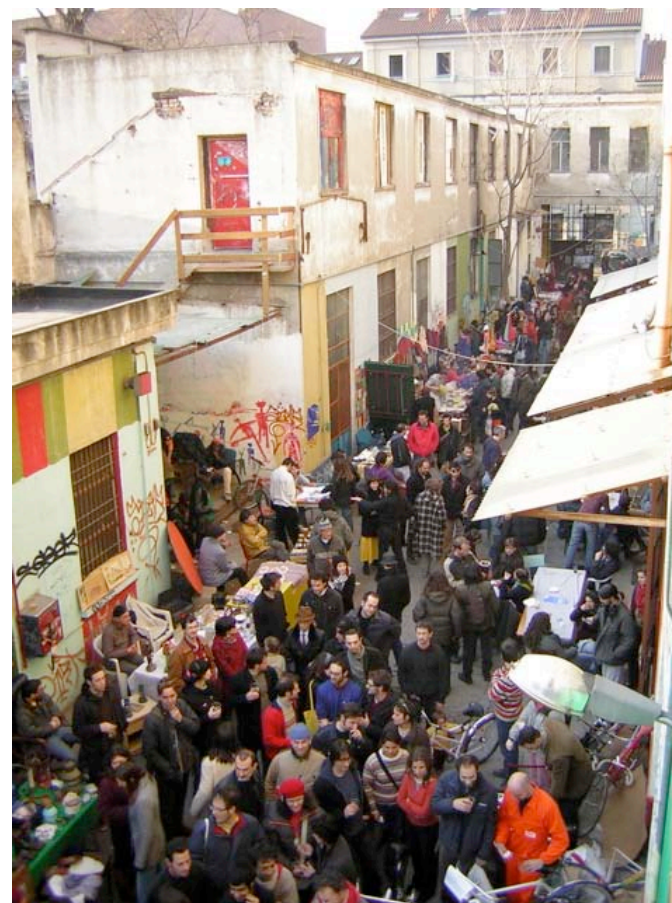
une journée à « la stecca degli artigiani »

la télé street du quartier qui travaille à partir de la stecca