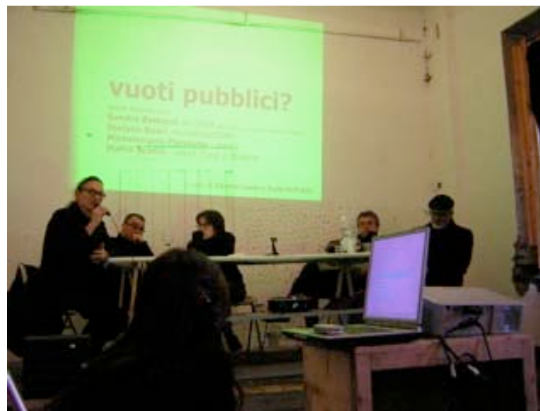
conférence publique sur la transformation urbaine organisée à la « stecca »