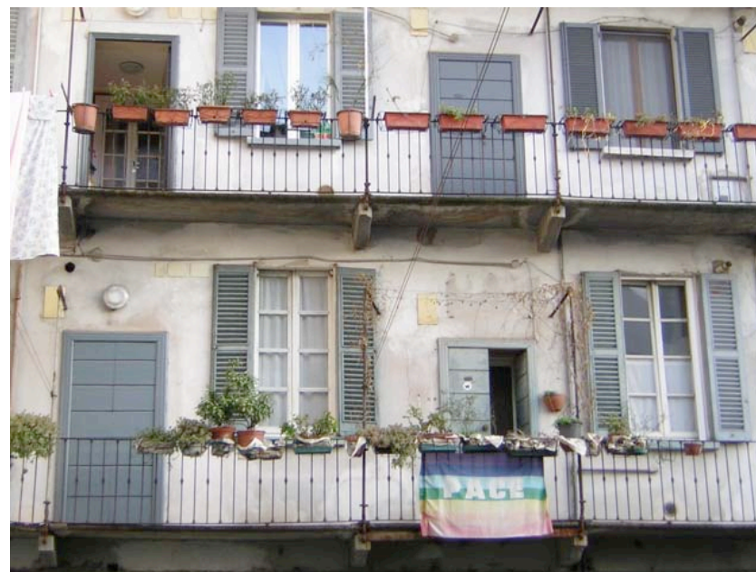
le quartier isola à Milan, bâtiment populaire typique.

réaménagement imposées par les institutions et les grandes entreprises privées qui voueraient à l'exclusion la population existante. J'ai rencontré beaucoup de difficultés, mais travailler dans ce contexte est très stimulant et enrichissant d'un point de vue humain et professionnel. En même temps je suis entré en contact avec une réalité d'exclusion urbaine et de pénurie de logement très grave en travaillant avec ASF-Italia. Avec deux bénévoles de cette association, j'ai réalisé une recherche et une analyse des conditions de vie précaires dans les nombreux bidonvilles et installations informelles qui existent à Milan, et j'ai travaillé à la construction d'un réseau opérationnel de réponse à ce problème, à travers notamment l'organisation de conférences et débats publics avec d'autres associations milanaises intéressées par le sujet.